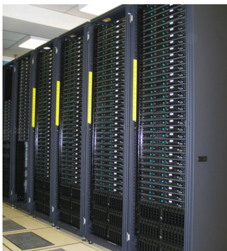
Un site d'une grille de calcul

Savez-vous que les ordinateurs ne seront jamais assez puissants pour résoudre de manière exacte des problèmes d'apparence simple ? Par exemple, comment optimiser les tournées d'une flotte de camions de livraison pour économiser leur essence ? Le LRI développe des algorithmes probabilistes qui calculent très rapidement une solution dont on peut garantir qu'elle est presque exacte.